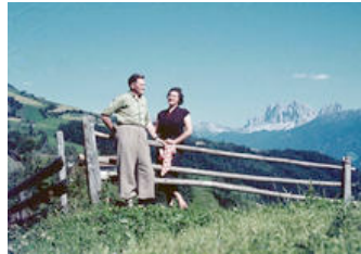
Liebe vor großartiger Kulisse

Sie haben sich geliebt. Sie haben sich vertraut. Ihre Zeit haben sie nicht nur miteinander verbracht, sondern tatsächlich miteinander verlebt. Verlässlichkeit und Beständigkeit war ihnen wichtig, weswegen sie in schönster Regelmäßigkeit in die Berge gefahren sind. Ja, die Berge haben ihrer Liebe Raum und Größe gegeben. Hier hatte sie Luft zum Atmen. Hier konnten sich die Liebenden aneinander festhalten. Hier konnten sie sich ausruhen von den Rastlosigkeiten des Alltags.